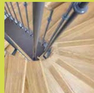
5 Escalier balancé pour ERP type voûte sarrasine sur 4 niveaux. Marches en bois de chêne sur limons latéraux en fer plat. Garde-corps à barreaudage vertical et main courante en bois débillardée. Ensemble laqué.